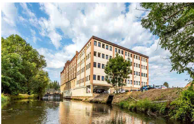
Légende: Le siège de Neudorff à Emmerthal, en Allemagne, produit sa propre électricité en utilisant l'énergie hydraulique de l'Emmer.

Les produits Neudorff sont en vente dans toute l'Europe. Vous trouverez plus d'informations sur Neudorff et son offre de produits pour un jardinage au naturel sur le site www.neudorff.fr