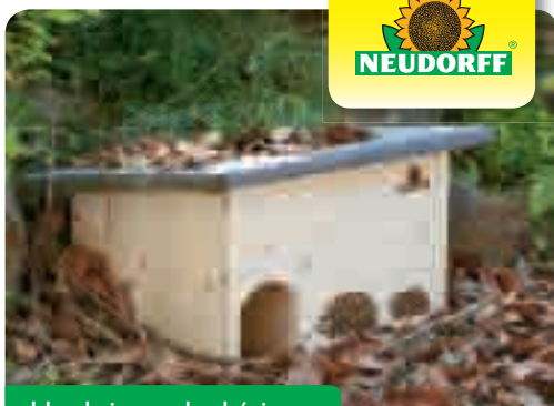
Un abri pour les hérissons